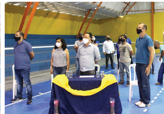
Cerimônia de reinauguração da quadra coberta