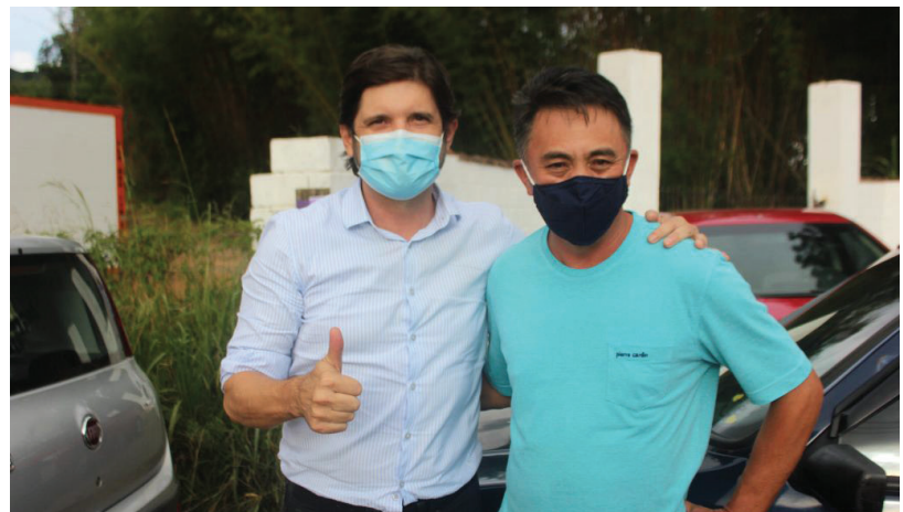
Deputado estadual André do Prado (PL)