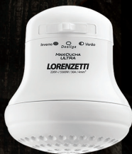
10% DE DESCONTO MAX DUCHA ULTRA lorenzetti