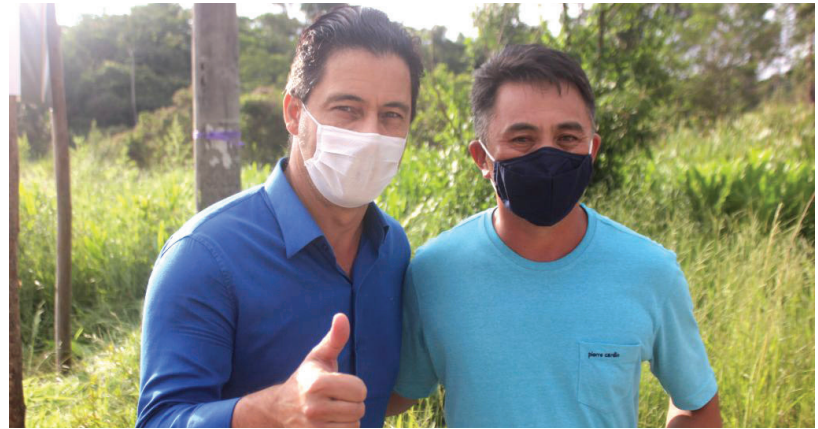
Deputado federal Marcio Alvino (PL)