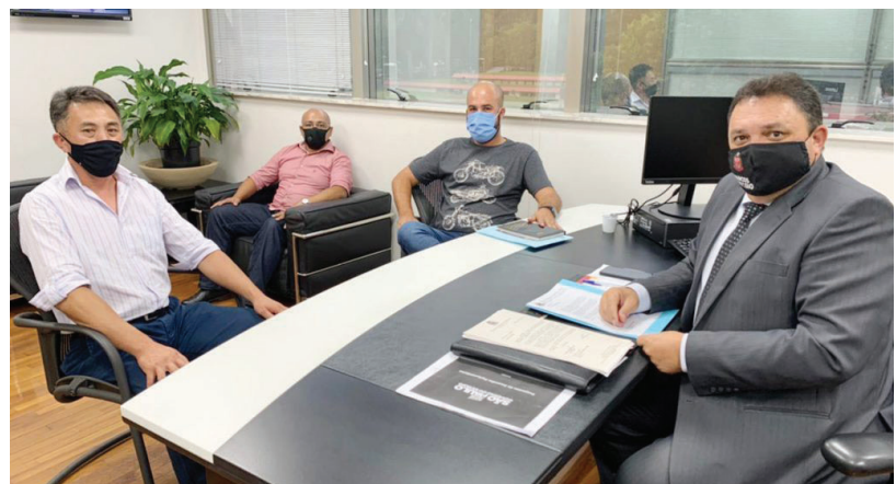
Deputado estadual Marcos Damásio (PL)