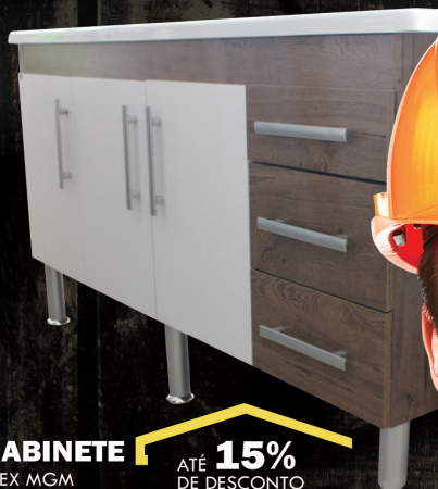
GABINETE FLEX MCM