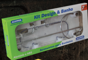
ATÉ 10% DE DESCONTO KIT DESIGN & BANHO Acessórios para banheiro