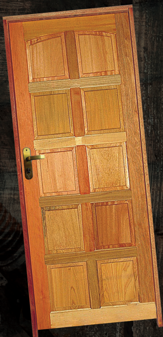
PORTA TOPAZIO 10 ALMOFADAS