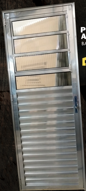
PORTA DE ALUMINIO BAS. 0,80