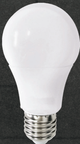
LÂMPADA LED BULBO 7W