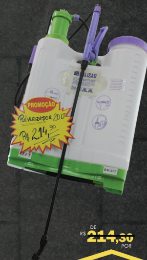
PULVERIZADOR EM OFERTA