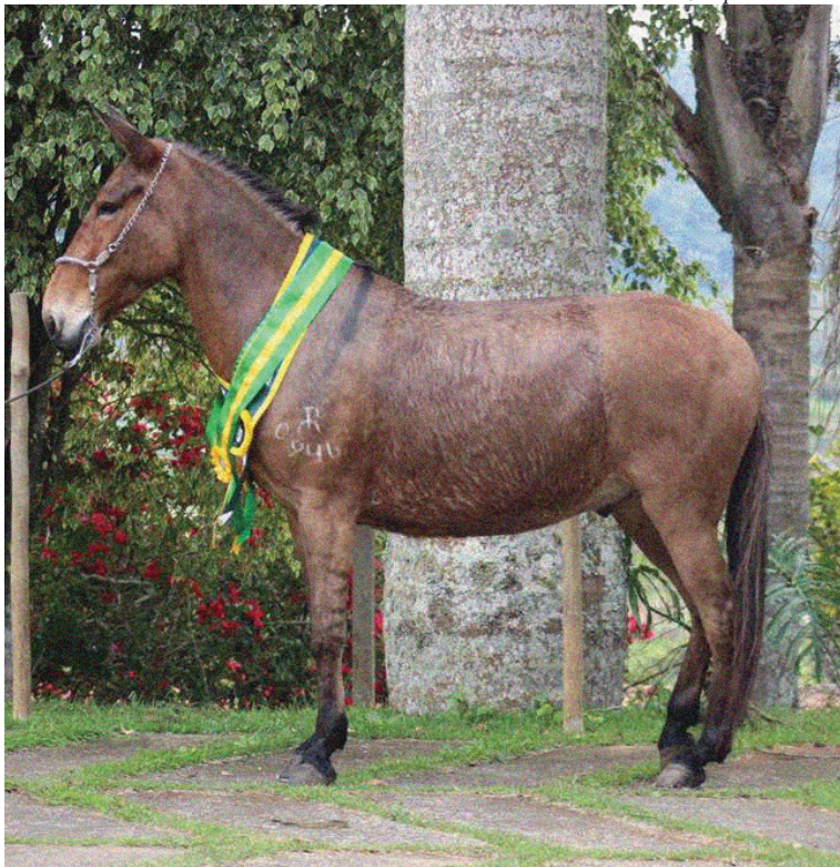
Burro Lampião MAZ