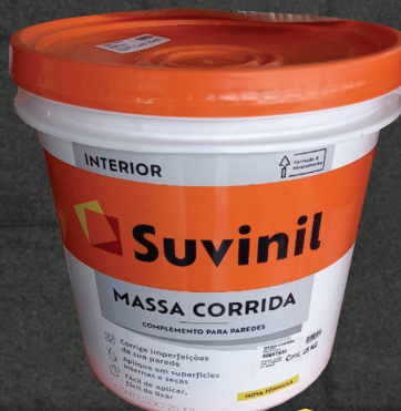
MASSA CORRIDA SUVINIL 25 KG

O sorteio será dia 8 de maio no dia das mães!