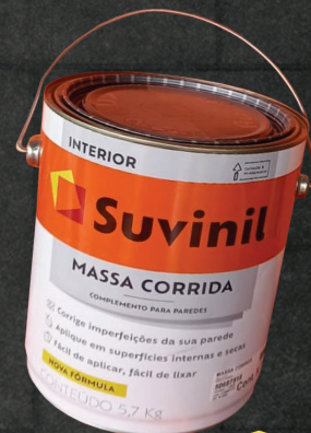
MASSA CORRIDA SUVINIL 5,7 KG