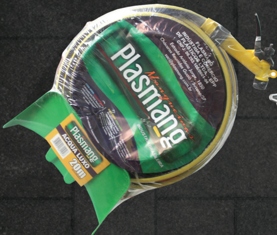
MANGUEIRA PLASMANG 20 METROS C/ BICO E SUPORTE

IMAGENS MERAMENTE ILUSTRATIVAS. OFERTAS ATÉ DURAREM OS ESTOQUES.