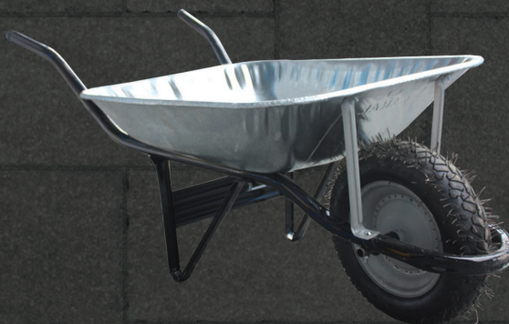
CARRINHO DE MÃO EM OFERTA