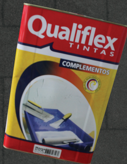
MASSA CORRIDA PVA QUALIFLEX LATA 28KG