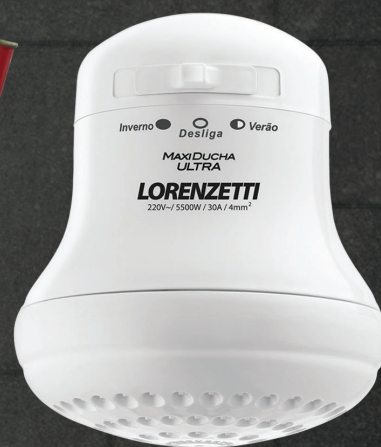
DUCHA MAXI DUCHA LORENZETTI 220V/5500W