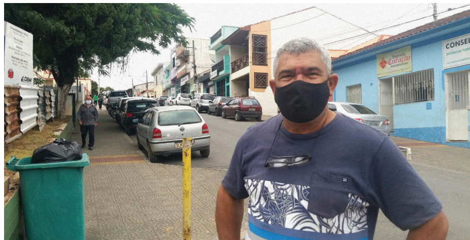
Vereador Mineiro na área central de Salesópolis

Restaurante Rancho Mineiro está de volta atendendo ao público