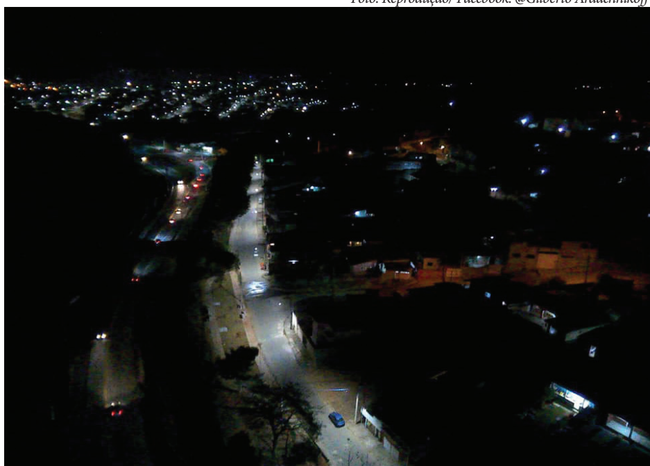
Bairro da Nova Biritiba Iluminada

A Prefeitura continua, informando que: “O servidor em questão atua no setor de entrega de insumos nas unidades municipais. Portanto, ele entra e sai dos equipamentos de saúde que prestam serviços diretos a pacientes com Covid-19”. Levando em conta as informações notamos que os funcionários da área da saúde como grupo prioritário em todas as cidades, sendo Suzano ou Biritiba Mirim, estaria devidamente correto, e necessário já que estão na linha de frente em meio a pandemia, estaria ilegal pessoas que furassem as filas que quem trabalha na área da saúde, portando estaria esclarecido.