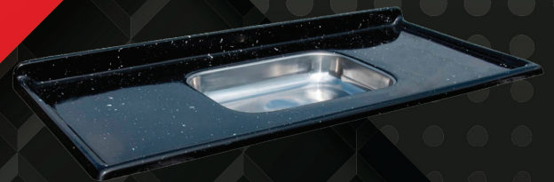
PIA ISAMARMORE 1.20CM - 1.50CM - 1.80CM - 2M