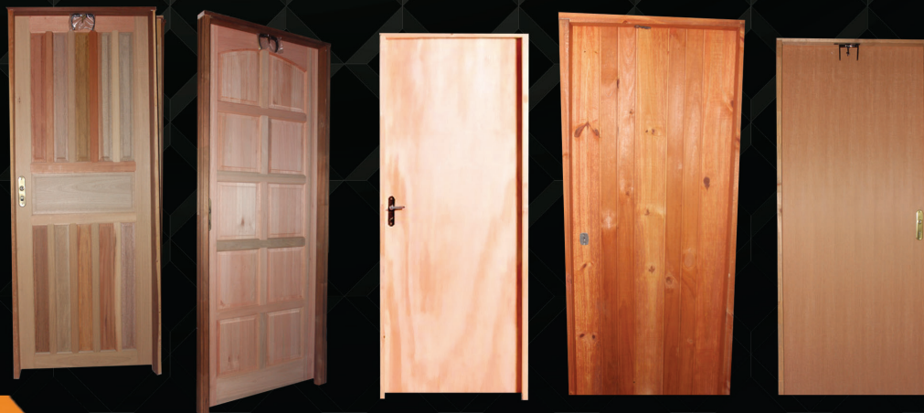
PORTAS MODELOS: PORTA AMERICANA, PORTA TOPÁZIO, PORTA LISA, PORTA CALHA E PORTA IMBUIA Tamanhos: 1.80x60cm - 1.80x70cm - 1.80x80cm