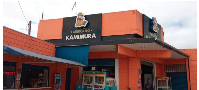
Primeira unidade no Jardim Yoneda