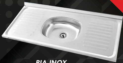
PIA INOX 1.20CM - 1.50CM - 1.80CM - 2M