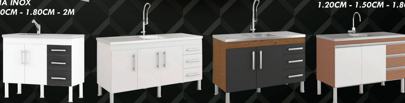
DIVERSOS MODELOS DE GABINETES