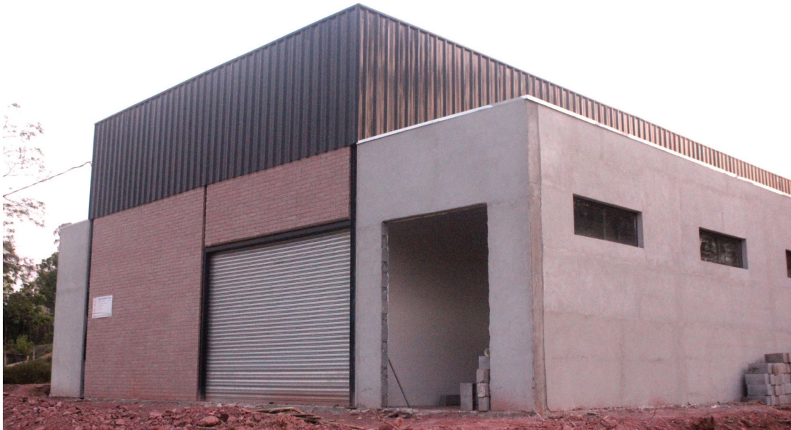
Nova unidade do Mercado kamimura no bairro Castellano - Endereço: Est. Mun. Vicente Castellano N° 470 - Biritiba-Mirim - SP

O Mercado Kamimura que virou referência por mais de uma década, trabalhando no bairro do Jardim Yoneda para os moradores da cidade de Biritiba Mirim comercializando diversos produtos e promoções em sua loja, com as mais variá-