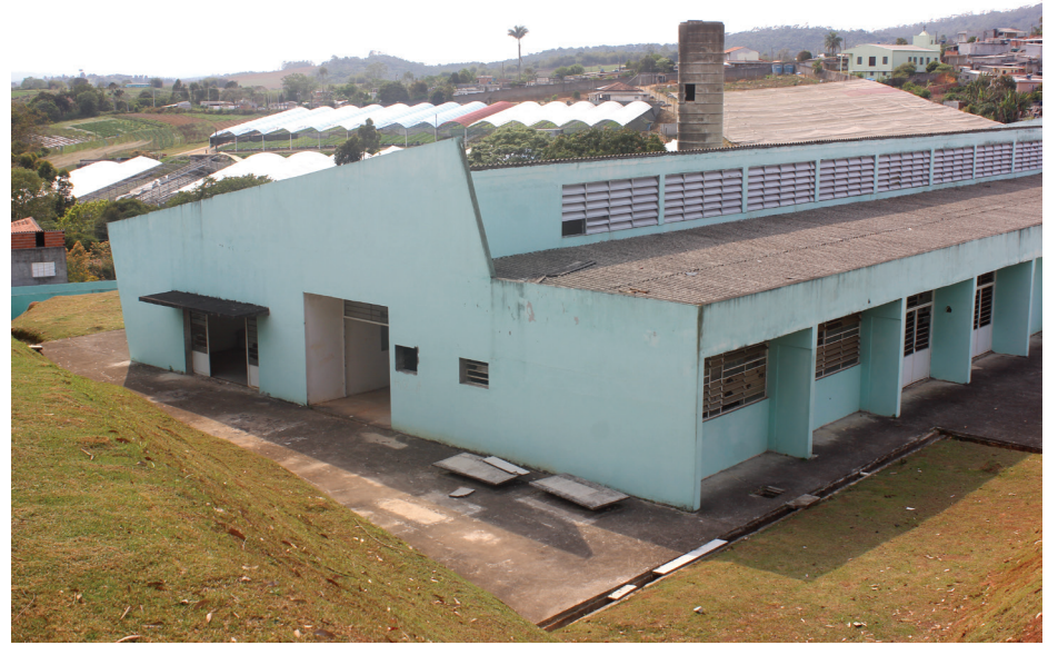
Creche Antonio Ferreira dos Santos (Creche do Jardim). Pág. 3