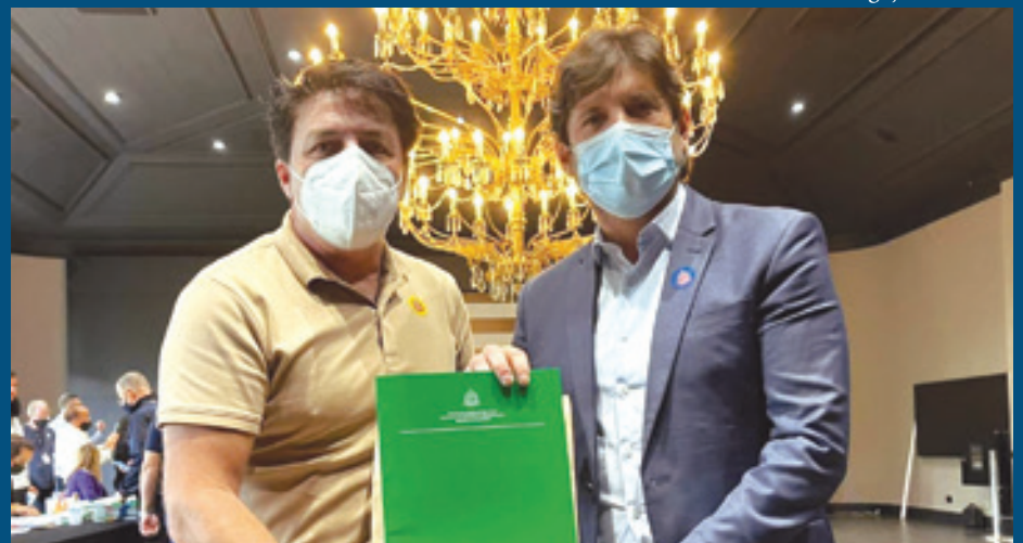
Prefeito e deputado conquistam mais convênios para a cidade