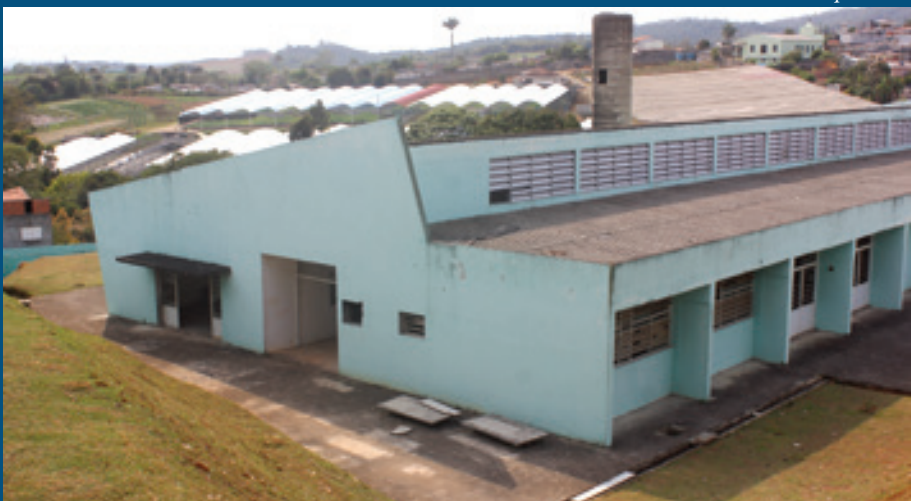
Obras na Creche do Jardim iniciam