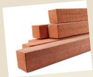
Caibro 5 x 5 cambara