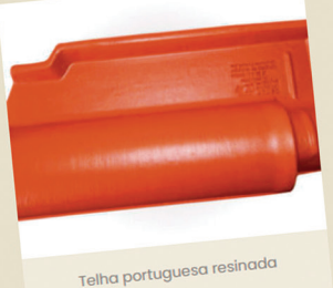
Telha portuguesa resinada

Oferta por tempo limitado, ou enquanto durarem os estoques.