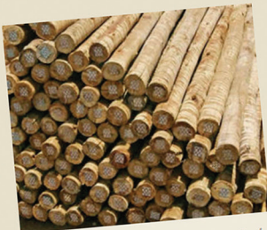
Mourão de eucalipto tratado 10 a 12 c/ 2,20