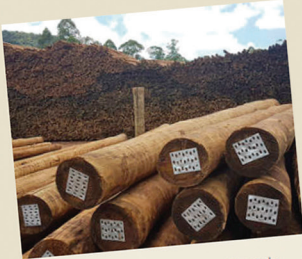
Eucalipto tratado 18cm a 21cm de diâmetro