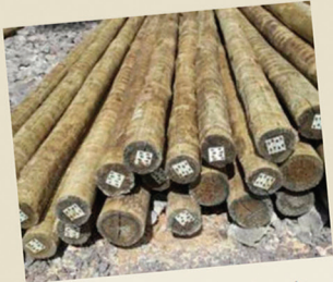
Eucalipto tratado 14cm a 16cm de diâmetro