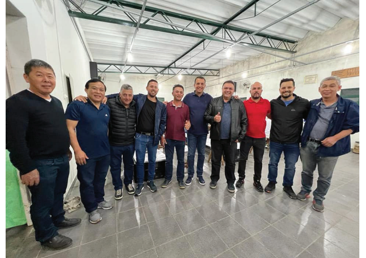
24ª Festa de inverno na Associação Rural de Desenvolvimento bairro Rio Acima