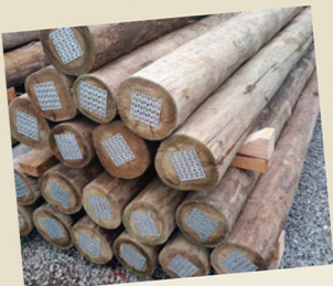
Eucalipto tratado 24cm a 26cm de diâmetro