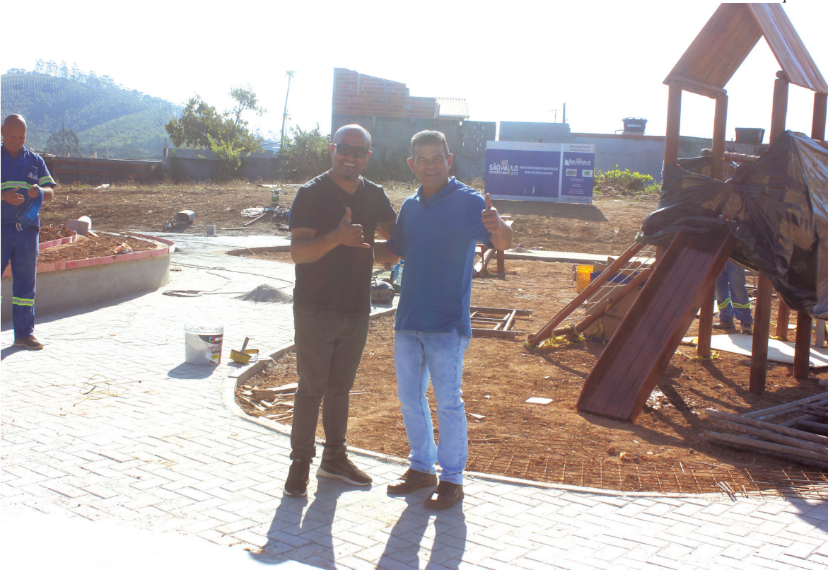
Nova Praça com Playground ao lado do ponto final do Jardim dos Eucaliptos