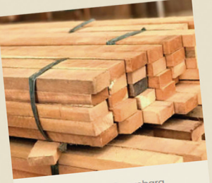
Ripão 2,0 x 5 cambara