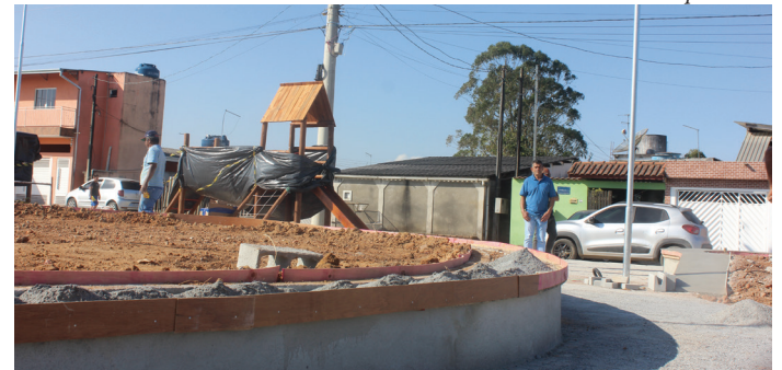
A obra está bem adiantada próximo ao ponto final