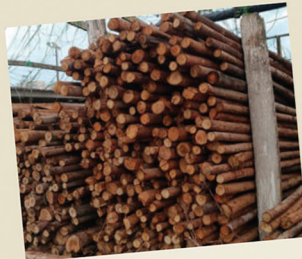
Pontaleta de eucalipto com 3 metros