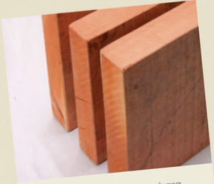
Prancha de 5 x 30 cambara