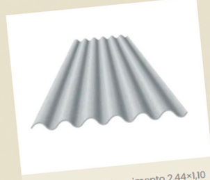
Telha ondulada fibrocimento 2,44x1,10