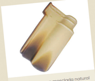
Telha portuguesa mesclada natural