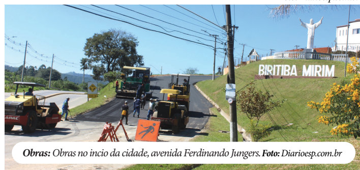
Obras: Obras no início da cidade, avenida Ferdinando Jungers.

incluindo a implementação de um sistema de vigilância abrangente e a instalação de portais de monitoramento em todas as entradas da cidade. Essas iniciativas visam garantir a segurança dos cidadãos e promover um ambiente de crescimento e prosperidade para todos.