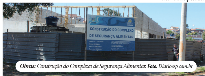
Obras: Construção do Complexo de Segurança Alimentar.