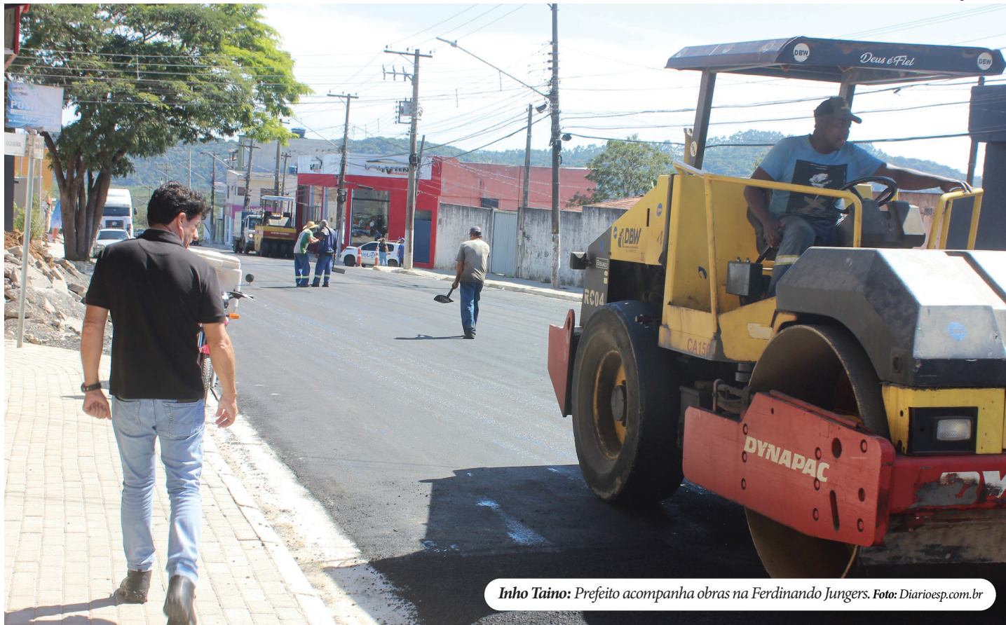
Inho Taino: Prefeito acompanha obras na Ferdinando Jungers.

gestão, incluindo os impactos da pandemia de COVID-19 e a luta contra a dengue. No entanto, ele ressalta o compromisso contínuo da administração em fornecer serviços essenciais de saúde e investir em melhorias, como a contratação de especialistas e a ampliação do transporte sanitário.